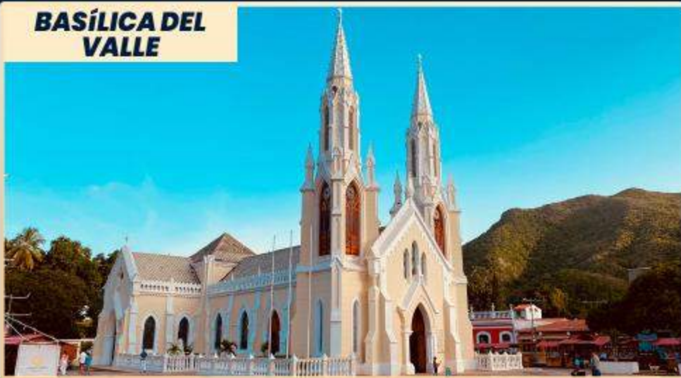
BASÍLICA DEL VALLE