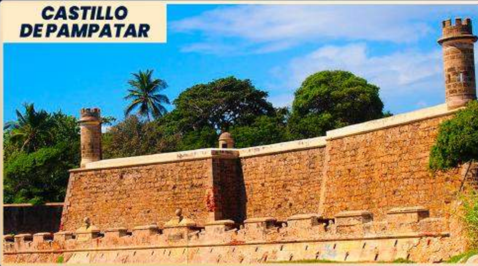
CASTILLO DE PAMPATAR