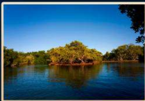
Laguna "La Restinga"