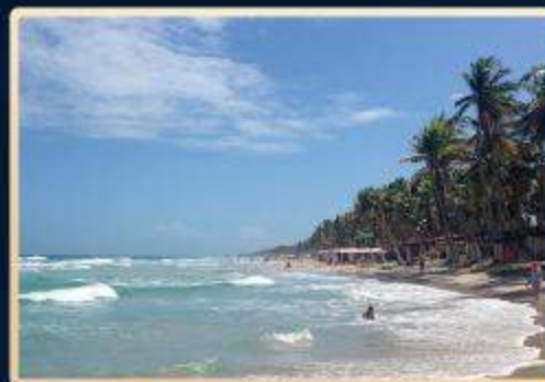
Playa el agua