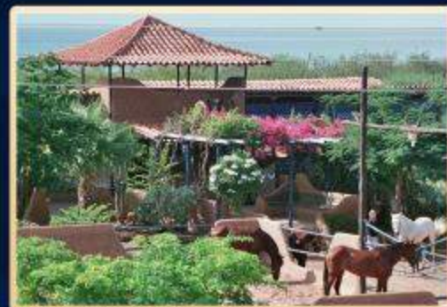
Cabatucan en Macanao