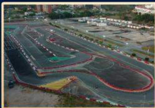
Karting del canódromo