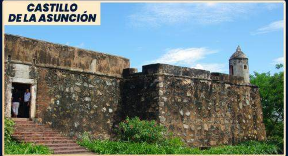
CASTILLO DE LA ASUNCIÓN